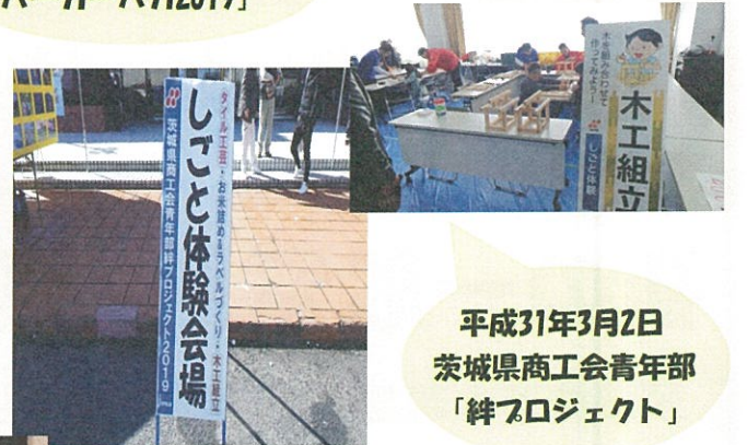
平成31年3月2日 茨城県商工会青年部 「絆プロジェクト」