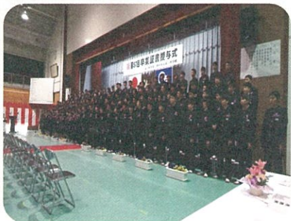
平成31年3月13日 「那珂一中卒業式」