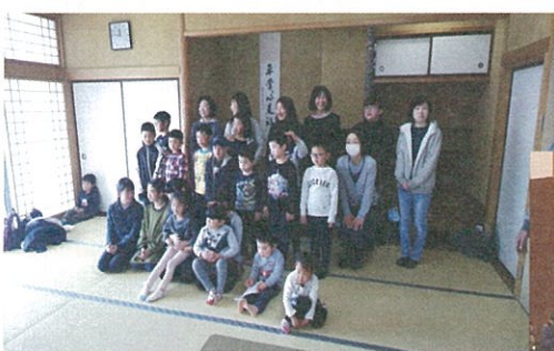
平成31年2月24日 「子供会6年生を送る会」