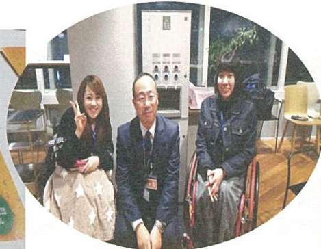
平成31年2月9日 「福祉研修会 in 東京」