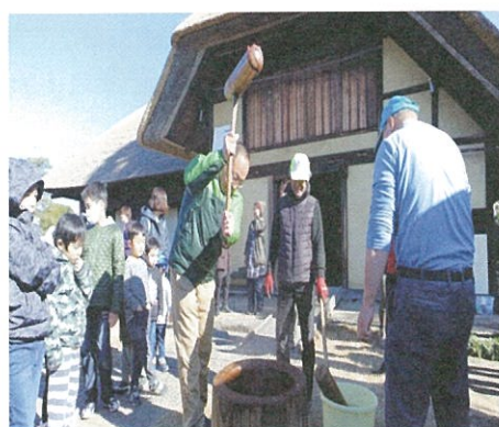
平成31年1月14日 曲がり屋