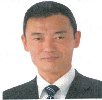
中田 宏 前横浜市 市長 元衆議院議員